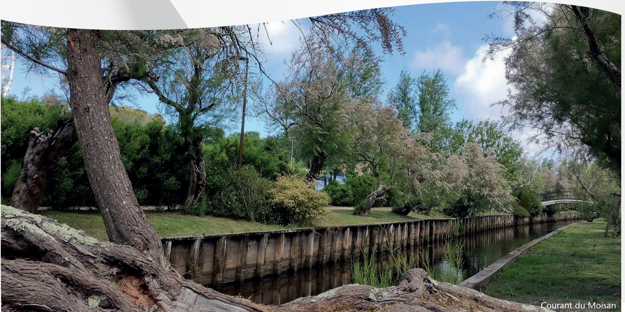
Courant du Moisan